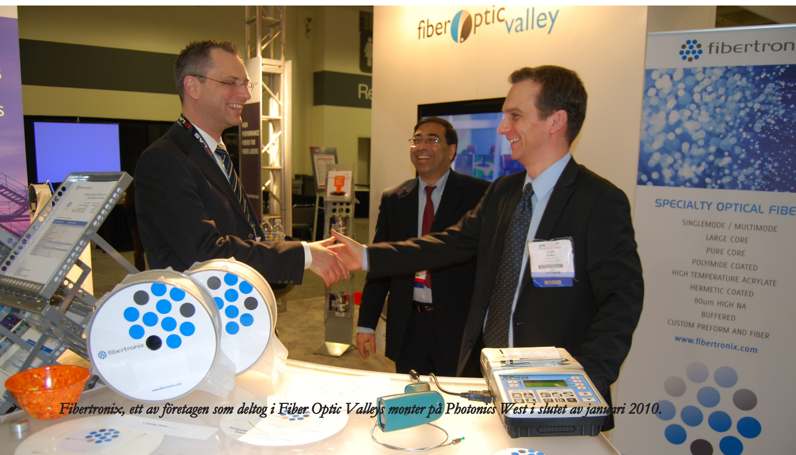
Fibertronix, ett av företagen som deltog i Fiber Optic Valleys monter på Photonics West i slutet av januari 2010.

Läs mer om Fibertronix på www.fibertronix.com